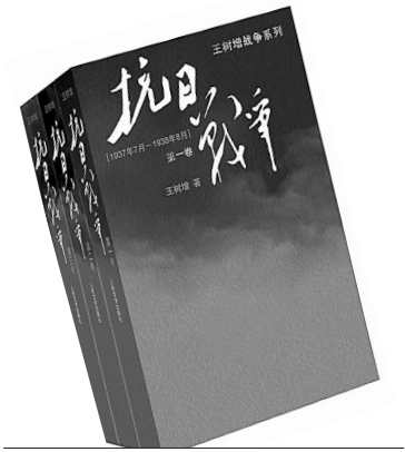
《抗日战争》 王树增 著 人民文学出版社

本书站在全民族抗战的立场上，在世界反法西斯战争的大背景下，以重大战役战斗为轴，以重大历史事件及相关人物为经纬，突出反映并全景式地记叙1937-1945年这八年抗战中的主要战役战斗。对我双方的战役企图、计划，兵力部署，作战行动和战役经过，都做了详尽的记叙，特别是对战役战斗结局及其经验教训，能从军事学术的高度给以分析、总结与点评。全面讲述抗日战争历史，是历史的需要，也是现实的可能。王树增的战争系列一直在努力达到这一目标，这也是他的战争写作的价值所在。正是基于此，王树增完成了他战争系列最为宏阔的一部作品《抗日战争》。