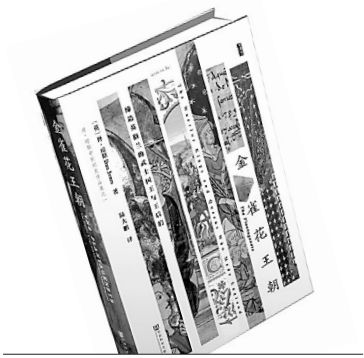
《金雀花王朝》 (英) 琼斯 著 社会科学文献出版社

人类社会正深度融合，但由于政治制度、历史传统、风俗习惯、宗教信仰和经济发展水平之间的差异性，全球在很多问题的认识、行动方面，并没有达成共识，更没有形成统一的世界秩序。基辛格在本书中认为，西方秩序正走向崩溃，美国已经失去领导者地位。新秩序的建立，不是一个国家能够主导和完成的。通读本书，全球各地近处的变迁尽收眼底，对于中国的历史定位和机遇也有了更深的认识。我们有幸生活在当代，更有幸生活在当代的中国。