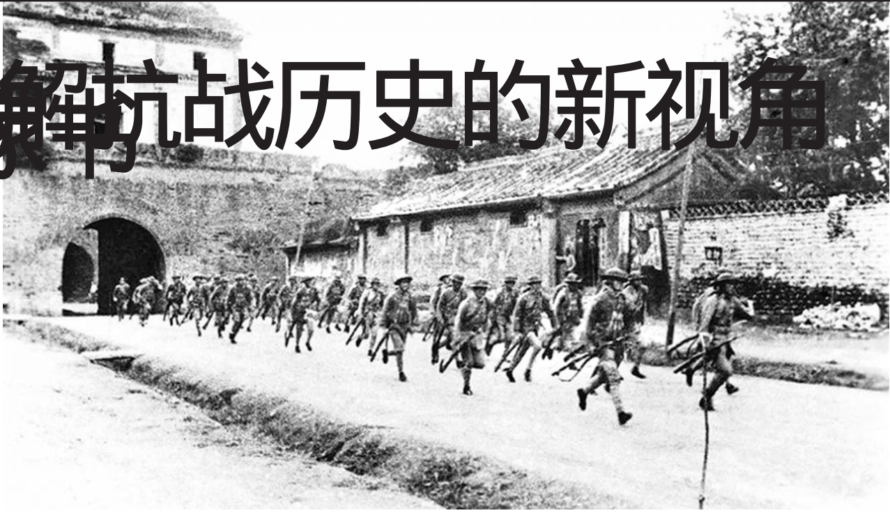
宛平城守军闻日军侵犯，出城赴战。